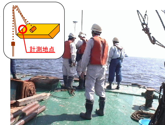
作業船での計測作業